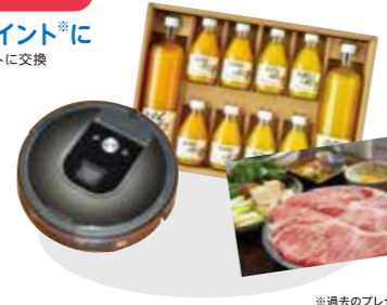
※過去のプレゼント例